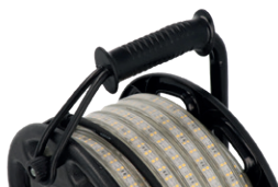
Griff mit integriertem Gummiband zur Rollenarretierung

Der LED-Lichtschlauch wird anschlussfertig mit 25 Meter auf einer Kabelrolle oder mit 5 bzw. 10 Meter auf einem Haspel geliefert. Der Netzanschluss erfolgt über das mitgelieferte Anschlusskabel. Das FlexLED Lichtband ist schnell und einfach koppelbar und kann so beliebig auf eine maximale Länge von 100m erweitert werden.